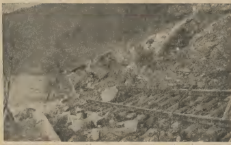
TEMBLOR BANDA DI DONAU - Habrimiento di terra causa pa temblor, a ocasiona danyonan grandi banda di e rio Donau den cercania di Pasa. Trafico ta paralisa aki banda. Accidente personal no tabatin ferocamente.

Bo yunan seguramente lo saborea un juice di peer - apricot y peach scogi di frutanan superior di e mundialmente famoso marca DEL MONTE! Scoge lo mehor... scoge calidad... scoge DEL MONTE! Spaar y cambia bo etiketanan na "CENTRO DE CAMBIO"